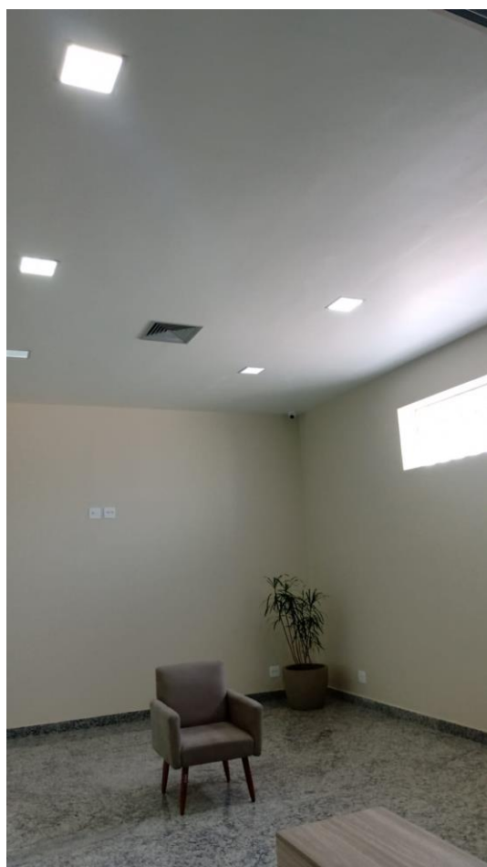
Local de construção das salas