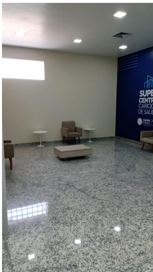
Local da construção das salas