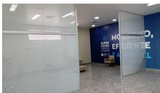
Exemplo de divisórias