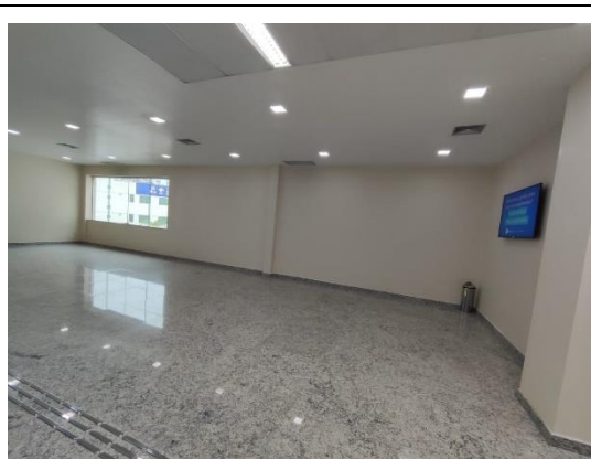
Local da construção das salas