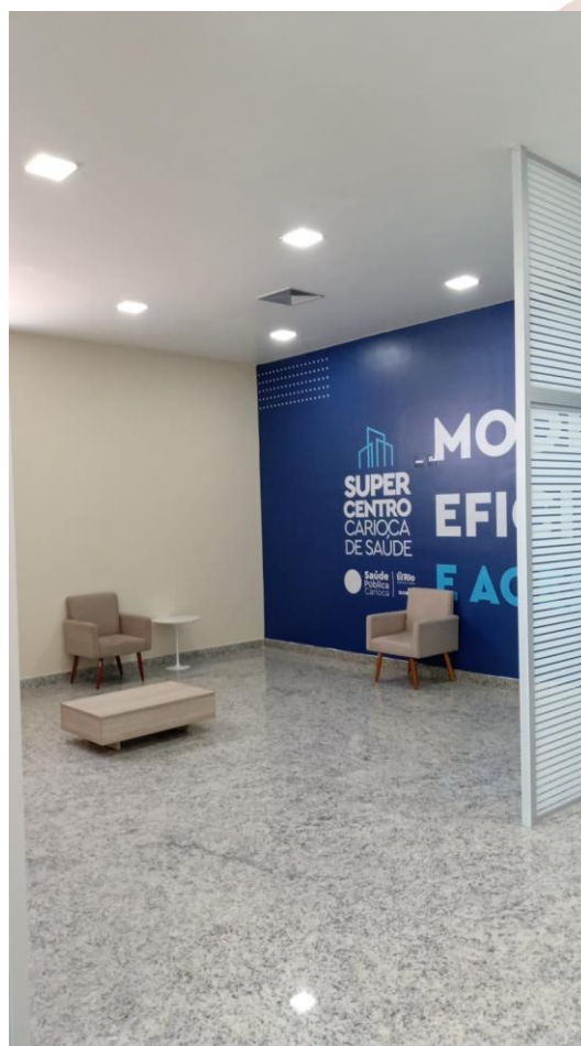
Local de construção das salas