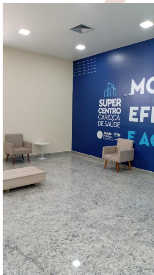
Local da construção das salas