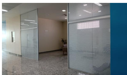
Exemplo de divisórias