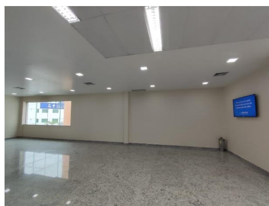
Local da construção das salas