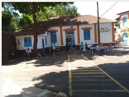
Fachada da unidade