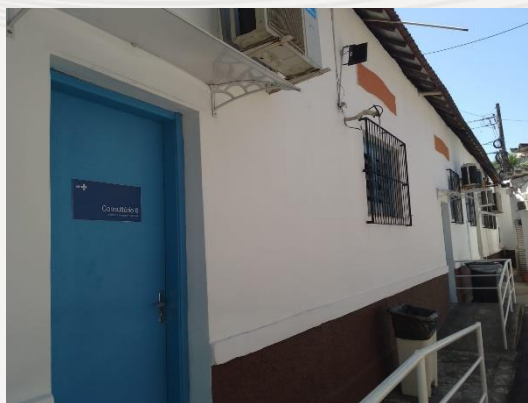
Lateral da unidade