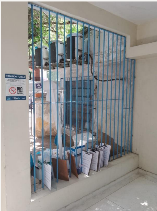
Área de espera