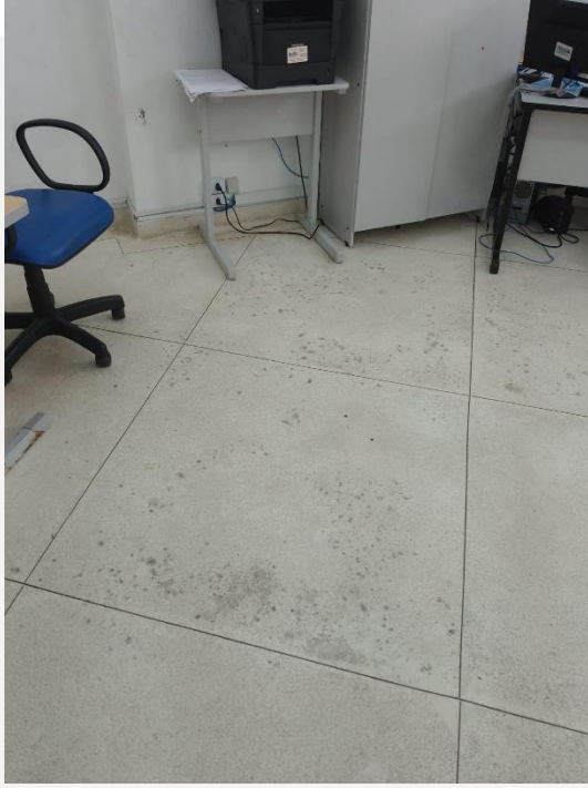
Piso da Adm