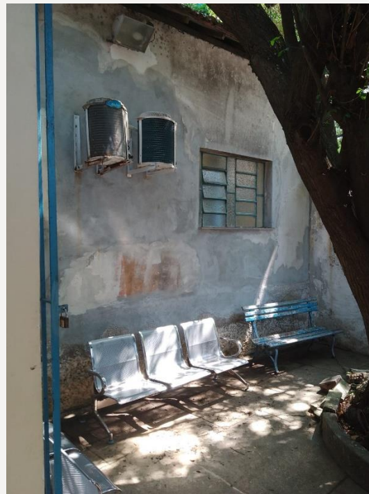
Parede lateral de fundos