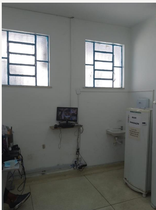
Sala da administração