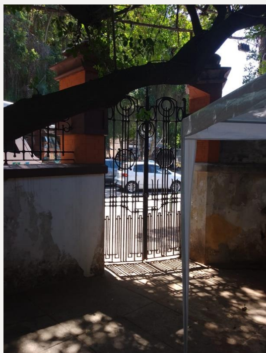
Portão de fundos