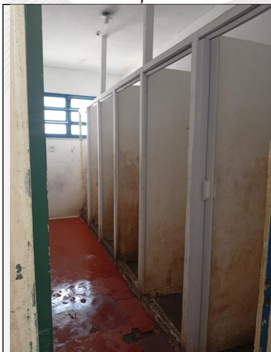
Pisos quebrados e paredes mofadas