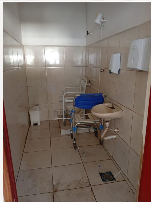
Cadeira ao lado da barreira sob o vaso sanitário