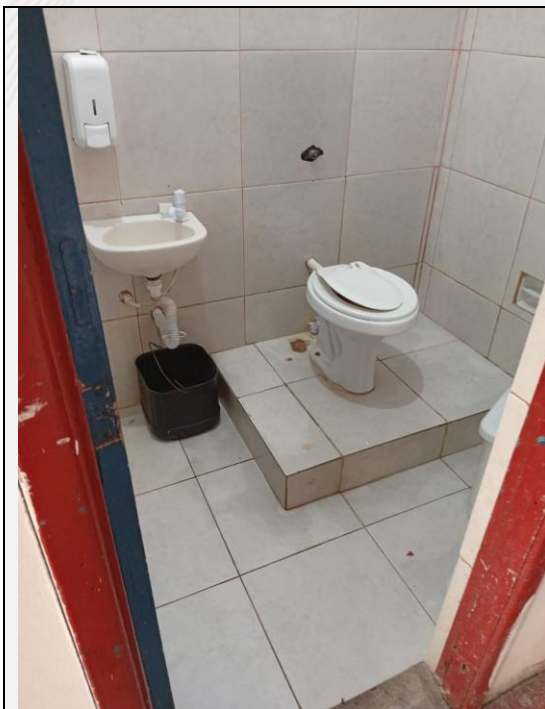
Empecilho a acessibilidade