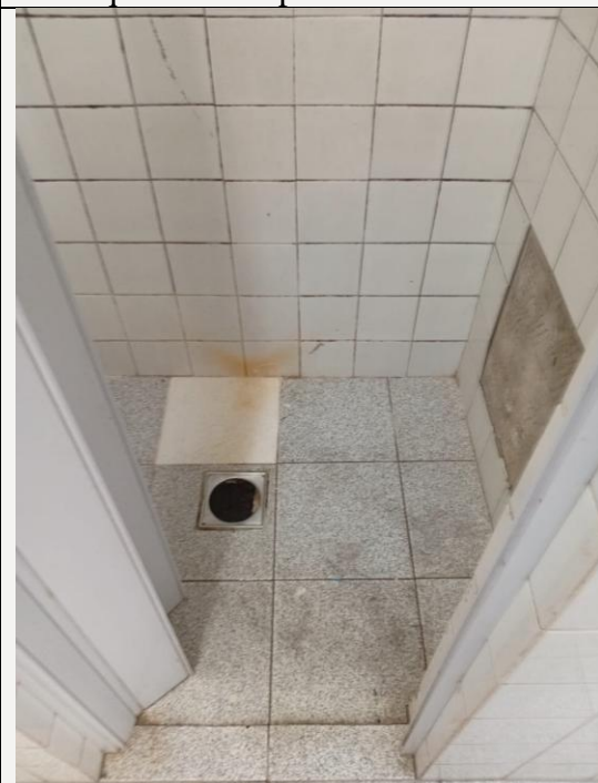
Azulejos quebrados e tampa de ralo faltante