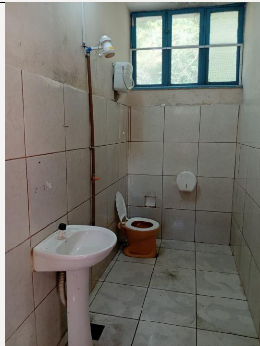
Piso quebrado e tubulação exposta