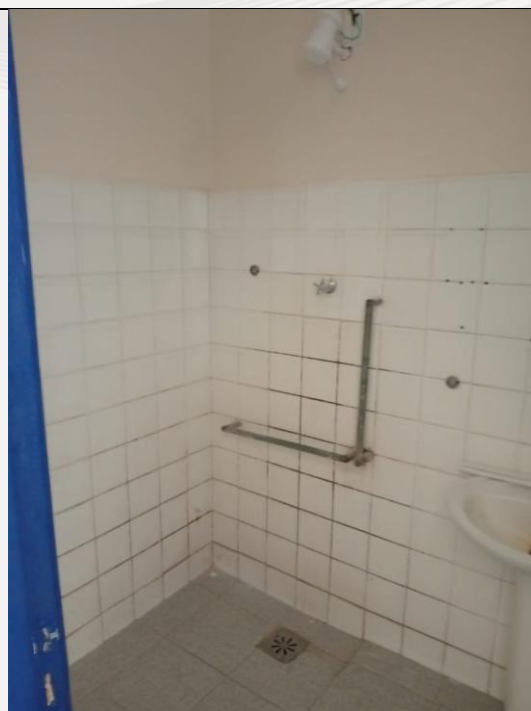
Barras de apoio inadequadas