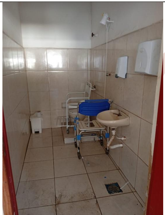
Cadeira ao lado da barreira sob o vaso sanitário