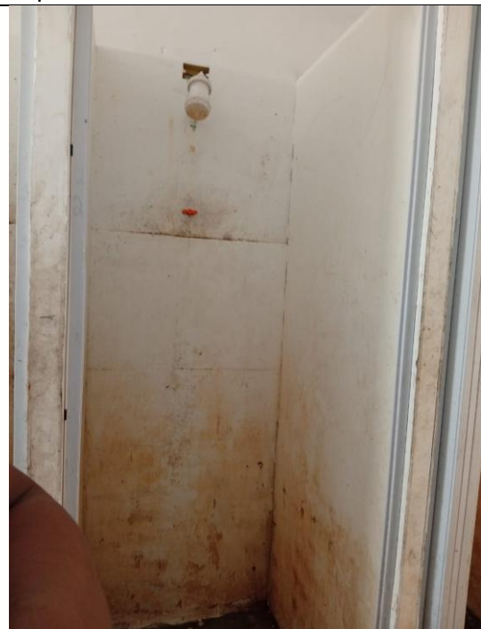
Pisos e azulejos quebrado e tubulação exposta