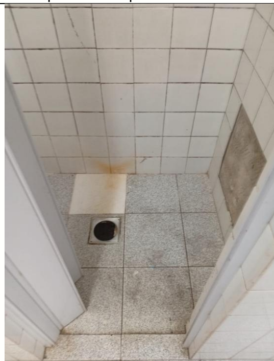
Azulejos quebrados e tampa de ralo faltante